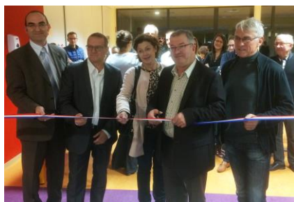
Inauguration de la crèche le 7 novembre

La crèche multi-accueil utilise les couches lavables et met en place de nombreuses mesures visant à réduire sa production de déchets et sa consommation d'énergie, afin d'obtenir le label écolo-crèche d'ici 2019. Ce label vise à améliorer la qualité de vie dans les lieux d'accueil, pour les enfants et les professionnels, en réduisant l'impact des lieux d'accueil sur l'environnement et en intégrant l'écologie de façon systématique dans l'éducation dès le plus jeune âge.