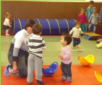
Ateliers cuisine et motricité du RAM

Dans le cadre des animations proposées aux enfants accueillis chez les assistants maternels, l'animatrice du RAM propose des moments d'éveil , des ateliers de découverte aux enfants avec leur assistant maternel, tous les mardis et vendredis matin, de 8h30 à 11h30.